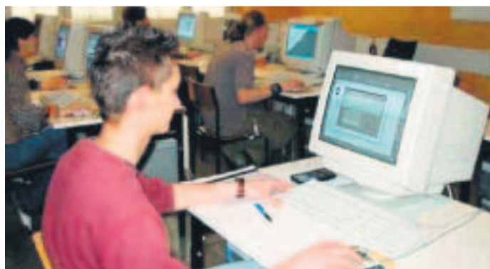
Am Rechner entstehen heute die meisten Werbemaßnahmen.

Die Buchstaben-Anlagen können freistehend, direkt oder indirekt leuchtend- und unbeleuchtete wie angestrahlte Buchstaben-schriften in Halb- und Vollrelief-Ausführung beinhalten.