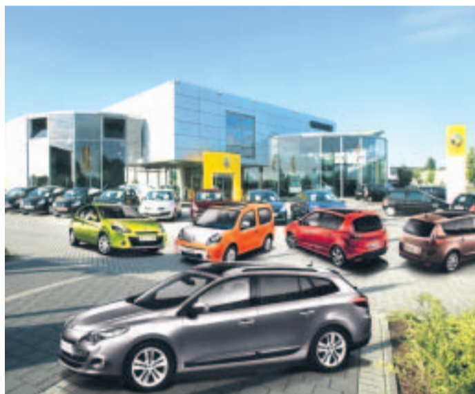
Autospaß zum Anfassen, heute im Hasepark.

Oder sie toben eine Runde auf der Western-Hüpfburg. Für die Erwachsenen bietet sich währenddessen ein „Auto-Bummel“ an, um die neuesten Modelle von Renault zu entdecken: Der peppige Kangoo be bob, der Renault Scénic und Grand Scénic, Mégane Grandtour und der Renault Clio. Alle Modelle können beim „Probesitzen“ ausgiebig erkundet werden. Übrigens wartet auch Nissan an diesem Premieren-Wochenende mit einem ganz neuen Stadtfitzer auf: Der Nissan Pixo gilt als echter „Preisbrecher“ und ist bei Einrechnung der staatlichen Umweltprämie schon ab 5490 Euro zu haben. (PA)